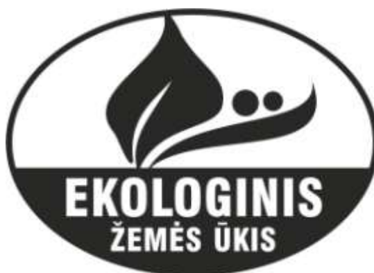
3 pav. Nespalvotas ekologiškų produktų ženklas

10. Nespalvotą (juodai baltą) ekologiškų produktų ženklą rekomenduojama naudoti tik nespalvotuose spaudos leidiniuose arba tais atvejais, jei spalvotas ženklas susilietų su produkto pakuote (žr. 3 pav.).