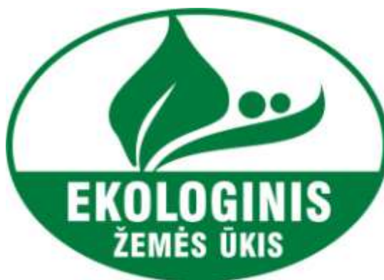
1 pav. Spalvotas ekologiškų produktų ženklas